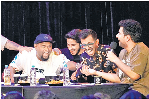
Controversies around India’s Got Latent and Pretty Good Roast Show helped spark the wave of format-driven comedy.