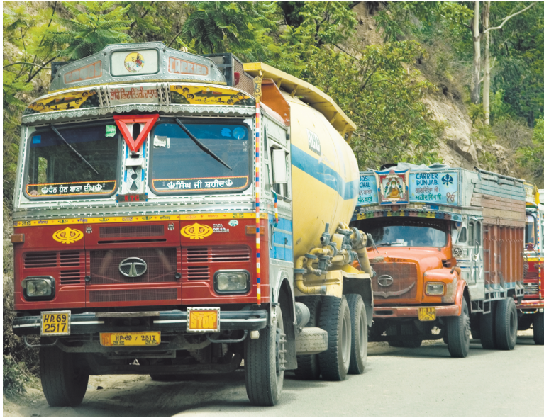
Currently, the constant speed fuel consumption (CSFC) test is used to determine the fuel efficiency of trucks.

to introduce Vecto by 2027 or 2028, BEE is clear that it wants to introduce and implement the norms from April 2027, and that any delay will not be acceptable, this person added. During consultations over norms, BEE has called for the industry to comply with regulations using existing testing methods, the people said.